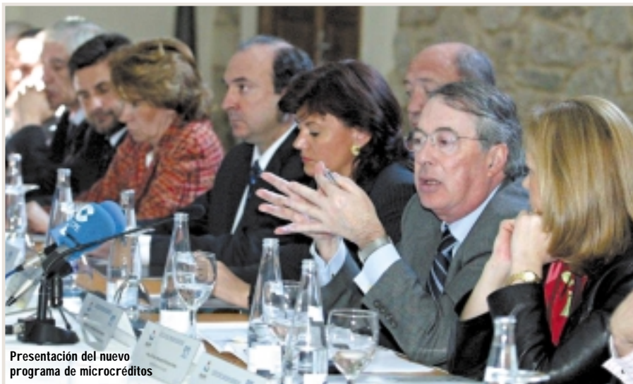
Presentación del nuevo programa de microcréditos