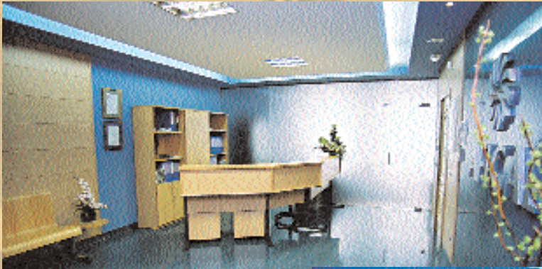
La recepción de las nuevas oficinas.