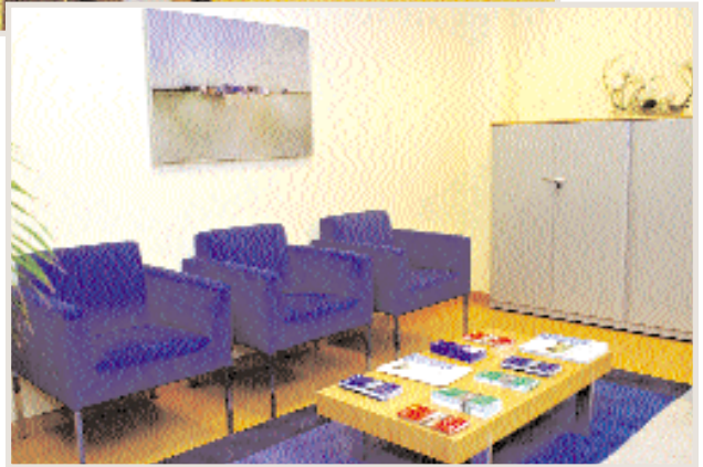
La nueva sede de Ferrol sobresale por la modernidad de sus oficinas, donde ya pueden acudir los socios de AFIGAL para tramitar sus operaciones.