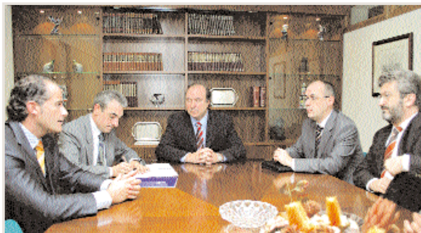
Representantes de AFIGAL y del Banco de Sabadell cierran el acuerdo

La línea de crédito abierta por el BBVA asciende a quince millones de euros para las operaciones avaladas por AFIGAL. Los socios de la institución podrán formalizar hasta 601.012 euros en la entidad financiera. El convenio ampara un variado repertorio de operaciones, desde préstamos para financiar acciones de comercio exterior, hasta financiación de divisas, pasando por anticipos de subvenciones públicas. Las pólizas de crédito, préstamos y arrendamientos financieros tendrán un tipo de interés de euribor + 0,50%, además de una comisión de apertura del 0,50%. Por las pólizas de crédito, se cobrarán además comisiones anuales de renovación del 0,25% y de disponibilidad del 0,15% trimestral.