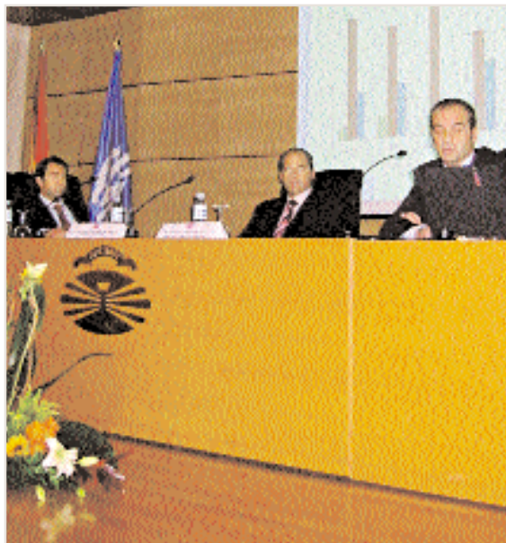
AFIGAL participó en las jornadas universitarias dedicadas a promover el espíritu empresarial

la sociedad en este ejercicio, frente a los 220 que lo hicieron en el 2003. Esta elevada cantidad de asistentes cumplió el objetivo programado de acercar los conocimientos sobre gestión financiera al mayor número posible de pymes. En gran medida, este propósito se ha cumplido gracias a la adaptación de los seminarios a las necesidades de los empresarios, que demandan una formación práctica, cualificada y en sesiones de corta duración.