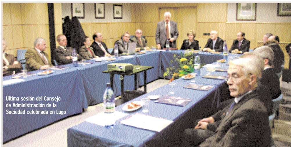
Última sesión del Consejo de Administración de la Sociedad celebrada en Lugo