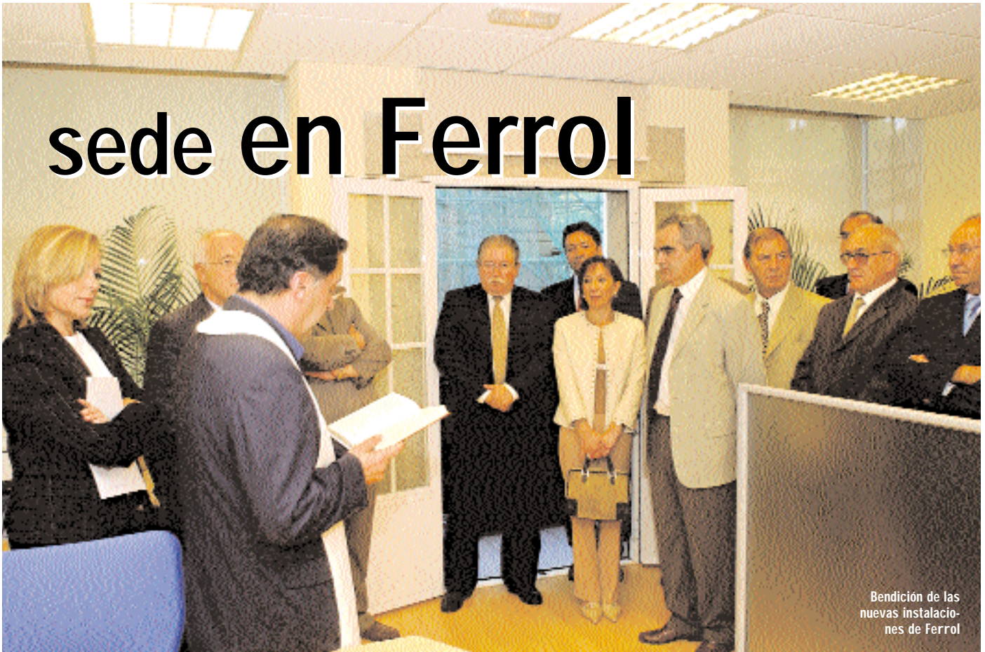
Bendición de las nuevas instalaciones de Ferrol

por Ferrolterra, donde los estudios de la institución "indicaban un renacer económico por la vía de las pymes". Desde ese convencimiento, se decidió invertir en las nuevas instalaciones con el objetivo de "duplicar las operaciones en la comarca" este mismo año. El presidente de AFIGAL expresó su confianza en que "en algún tiempo no lejano", se queden pequeñas las nuevas oficinas para atender las demandas de los empresarios de Ferrol.