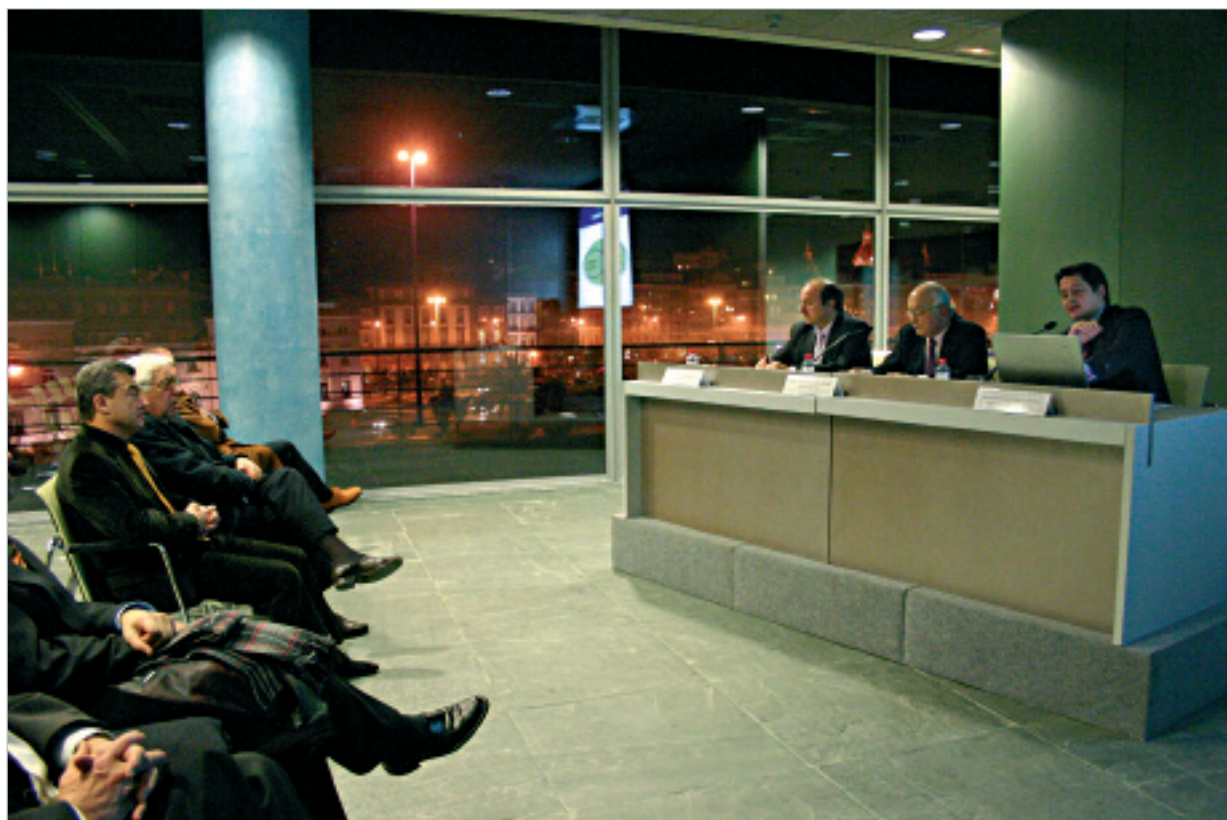
La entrega de diplomas del curso Gestión global de una microempresa cerró el Aula Financiera 2005 con un acto en el nuevo Palacio de Congresos de A Coruña