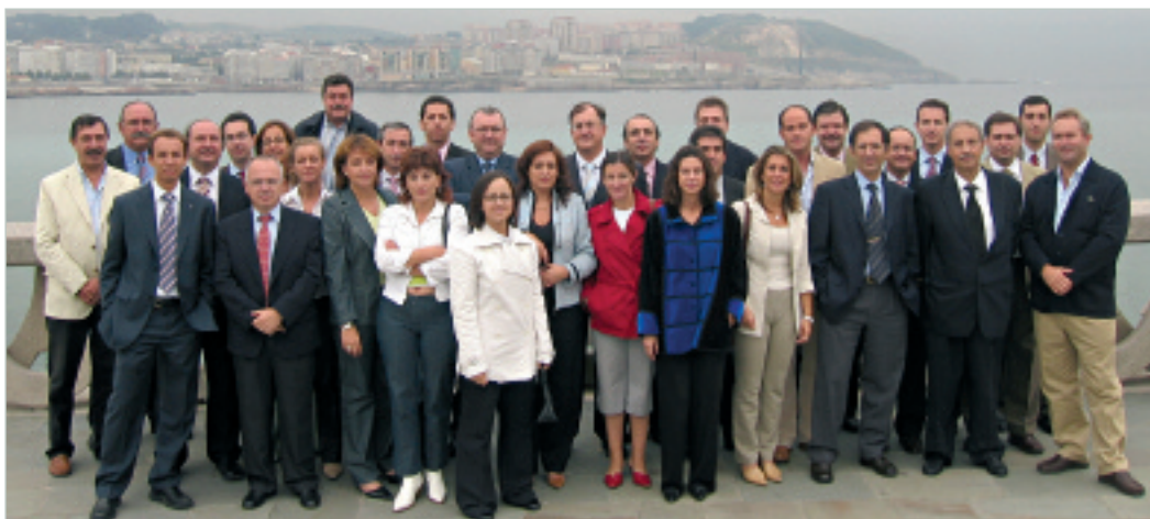
Os profesionais das Sociedades de Garantía Recíproca acudiron á convocatoria da confederación do sector (CESGAR) en A Coruña